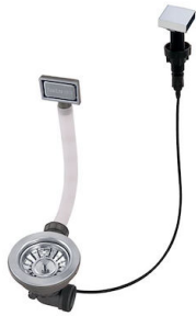
自动下水 8407 113